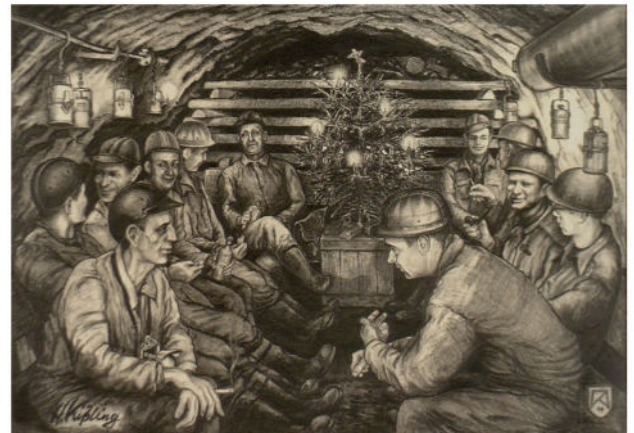
H. Kölling – 1908 Originalgröße 41,5 x 29,5 cm Blauverfärbung auf Zinkpapier

https://www.youtube.com/watch?v=k1N-KIstZiF8