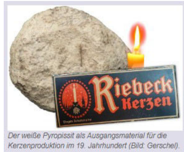
Der weiße Pyropissit als Ausgangsmaterial für die Kerzenproduktion im 19. Jahrhundert.

https://www.google.de/books/edition/Chronik+der+freien+Bergstadt+Schneeberg/CDA7L8VWQ0YC?hl=de&gbpv=1&dq=adventszeit+bergbau&pg=RA2-PA31&printsec=frontcover